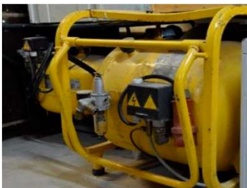
Kaeser Kompressor groß - 16A/400 V, 430 Liter