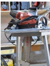
Tischkettensäge - Mafell ZSX400