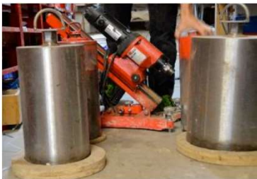
Kernbohrgerät - Würth Hand- und Ständerfuß geführte Bohrungen bis 300 mm