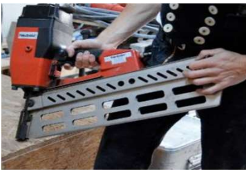
Schusser/Druckluft-Nagler 130-160 mm