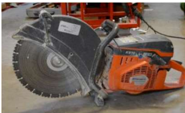
Betonschneider - Motorflex Husqvarna KS70, 350 mm