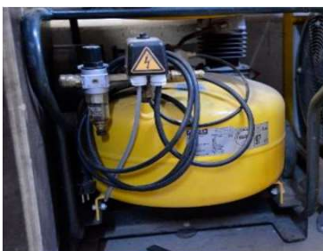
Kaeser Kompressor klein - 230 V, 340 Liter